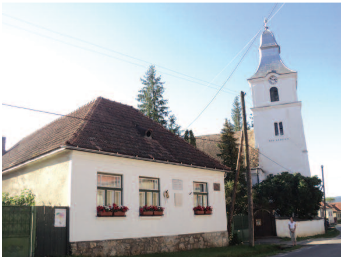
Brassai Sámuel szülőháza Torockószentgyörgyön