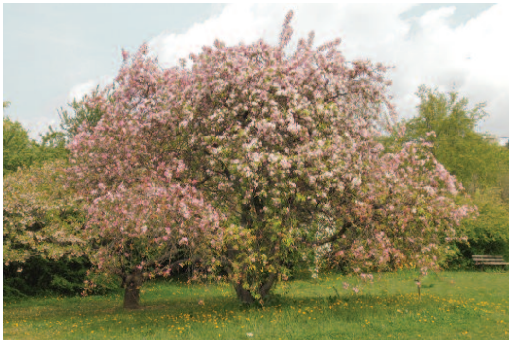
A bimbók reszkető selyemgubóiból zománcos fényű pompa, ezer szelíd szírom lepkéje tört elő – virágzó almafa