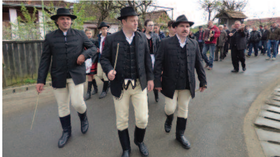
Rigmányban nem karácsonykor, hanem húsvétkor kantálnak

Jobbágyfalván nem kantálni, hanem öntözni indul a férfinep az ünnep mindkét napján délután. A sereg elején és végén „hamubotosok” vannak, akik távol tartják az idegeneket, de a rendetlenkedőkre, sorból kilógókra is rácsapnak botjukra kötött zacskójukkal. A menet mindenhová betér, ahol kinyitják nekik a nagykaput, és elmondják, hogy „eljöttünk hirdetni e kicsiny sereggel, hogy Krisztus feltámadott e szent ünnep reggel”, majd fenyőággal meglócsolják a lányokat, nőket a „Jordán vízből” vett vízzel, „mert ki e vízből részesül, az vagyon megírva, hogy az életnek terheit sokkal jobban bírja”. Természetesen itt is számos csínytevés, „bűn” adódik: ellopják a házigazda kulcsát, hogy „az asszonyához járhasanak”, van aki letegezi a királyt, vagy a csapómestert bezárja az illemhelyre, de az illetlen szavakért, a cigarettázásért, telefonálásért is bot jár, amit nem úsznak meg a hamubotosok sem, mert zaklatják a „szarkákat” (a menetnek tojást, szalonnát, bort gyűjtőket). Este a menetet a kultúrotthonba tér be, ahol rántottás vacsora várja őket, majd mindkét este bált tartanak. A húsvéti fenyőágazást és öntözést mindig valamilyen közösségi célért szervezik, az utóbbi években a bevételt (a helyiek pénzadományát és a báli belépőt) a helyi ravatalozó építésére fordítják.