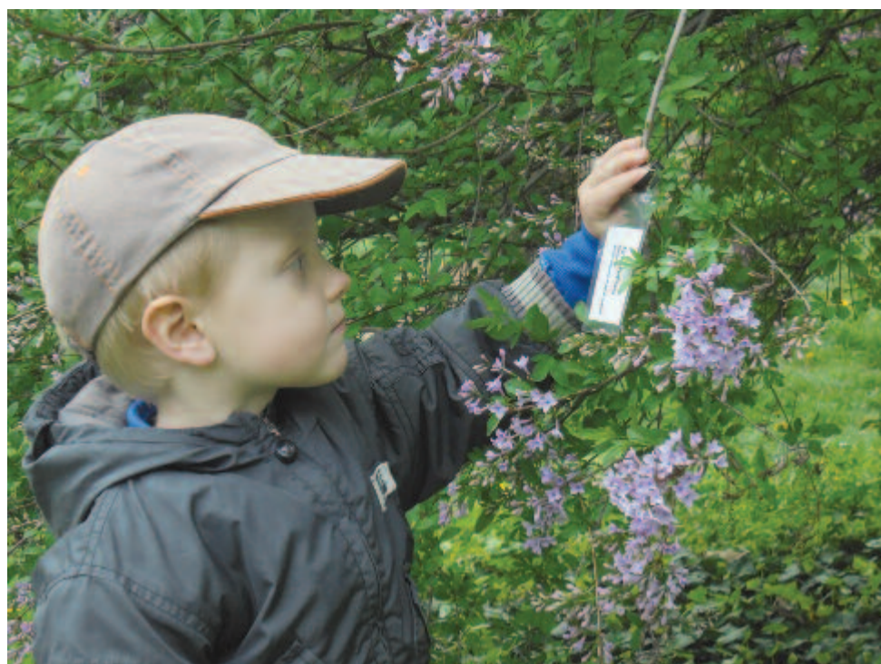
Jósika-orgona vizsgálata – a botanizálást (sem) lehet elég korán kezdeni

Süss föl nap, Szent György nap! Kert alatt a kislibáim Mégfagynak. Terítsd le a köpönyeged, Adjon isten jó meleget!