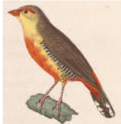
Aranymellű pinty vagy asztrild ( Amadava subflava )

tük sok magot termő, füves foltok, azokat megvizsgálja. Fiókáit ritkán neveli saját készítésű fészkekben; rendszerint a szuhabujók, vidapintyek és szövőmadarak elhagyott fészkeit hozza rendbe, és azokban költ. Hátoldala zöldesszürke, szemcsíkja és farkörnyéke élénkpiros, testlájának közepe fényes sárga, a begye és hasa gyakran narancsvörös.