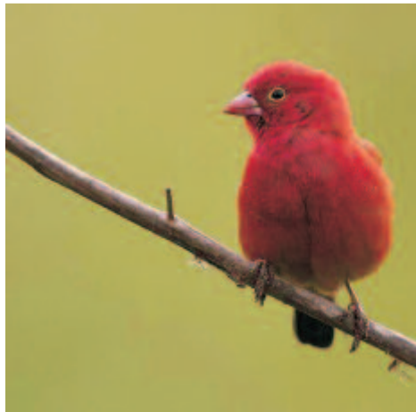
Piros díszpinty vagy amarant ( Lagonostica senegala )

Színezete kármínpiros, a mellén finom fehér pettyes, a háta és a szárnya barna. Afrika déli részén él, a Szaharától délre, a tövises-bokros területeken. Kedveli az emberi települések közelségét, a házak között is fészket rak.