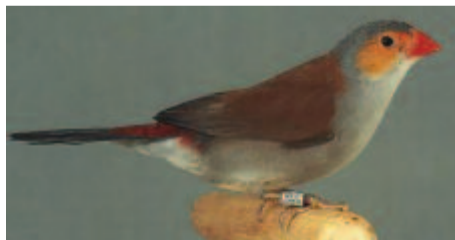
Narancspofájú asztrild ( Estrilda melpada )

Nyugat- és Közép-Afrika minden olyan területén él, ahol magas fű terem; a savannákon, a folyók mentén vagy az őserdei tisztásokon egyaránt jelen van. A hossza csak 10 cm. Nevét a fej oldalainak narancsszínéről kapta. A feje többi része világos hamuszürke, a háta őzbarna, hasának közepe sárgás, a farkcsíkja vörös.